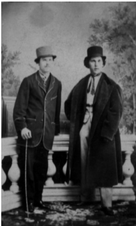
Ф. М. Достоевский с братом