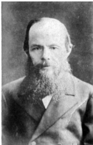
Ф. М. Достоевский