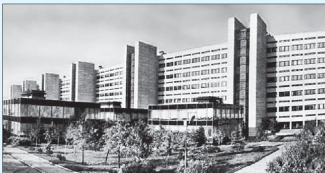
Здание Института космических исследований. Москва.

сконцентрировать усилия на нем. Такой ведущей темой стала Венера*.