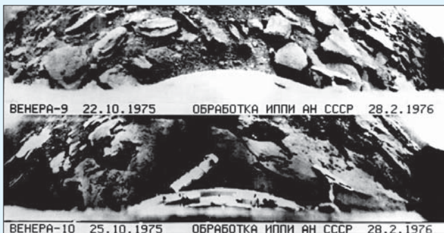
Панорамы поверхности Венеры, переданные на Землю аппаратами «Венера-9» и «Венера-10».