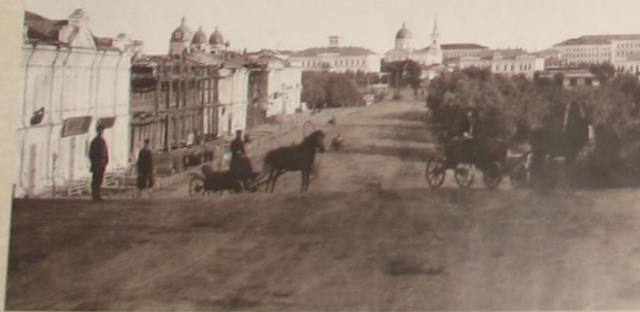
Центральная часть города до строительства Минусинская почтовая линия. 1904