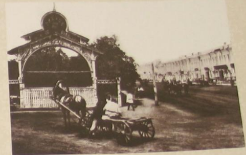
Вид в Лыбину роту. Конец XIX — нач. XX вв.