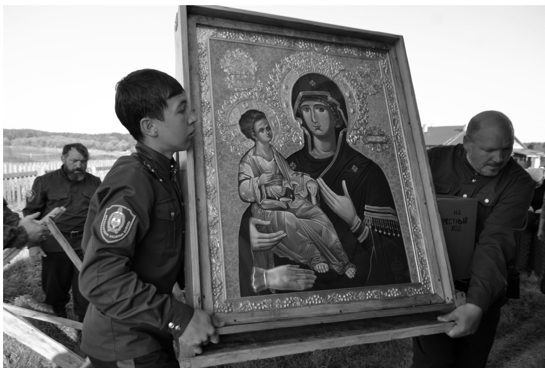
Рис. 7. Икона Пресвятой Богородицы «Троеручица» 2016 г., Вятка

Пресвятой Богородицы «Троеручица» из сербского монастыря «Рукумия» (рис. 7), иконой преподобного Сергия Радонежского с частицей его святых мощей со Свято-Троицкой Сергиевой Лавры, иконой новомученика святителя Сильвестра Омского с частицей его мощей из Кафедрального собора Успения Пресвятой Богородицы г. Омска) прошли 1 800 км по Иртышу и посетили 21 приход Тарской епархии, где совершались службы, молебны, крестные ходы, встречи с местным населением. Крестный ход возглавляли оренбургские казаки Межрегиональной общественной организации «За Святую Русь», которые провели более 30 встреч с населением северных районов Омской области в музеях, библиотеках, больницах, тюрьмах. В 88 отдалённых селениях местные жители имели возможность поклониться святыням и познакомиться с этнокультурными особенностями славян. С 7-го по 26 сентября 2016 г. казачий крестный ход продолжился на автомобиле (около 4 000 км) и посетил 67 приходов Тарской епархии. Командир конвоя иконы Пресвятой Богородицы «Троеручица» (г. Новий Сад, Сербия) Миодраг Баич смысл своей миссии объясняет так: «Мы идём крестным ходом по России и по госу-