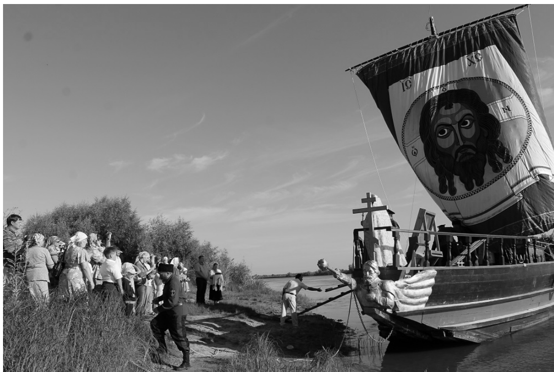
Рис. 6. Встреча казачьего струга «Ермак» 2016 г., Тевриз

Второй пример. С 9-го по 31 августа 2016 г. казачий струг «Атаман Ермак – Князь Сибирский» (рис. 6) со святынями (иконой