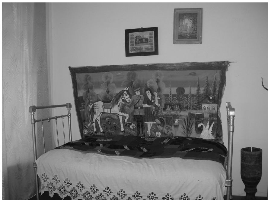
Рис. 3. Интерьер казачьей горницы. Реконструкция. 2005 г.

По вероисповеданию подавляющее большинство сибирского казачества являлись православными. Спецификой сибирских казаков было наличие «походных церквей», которые называли также «Ермаковыми часовнями», и старообрядческих икон (рис. 4).