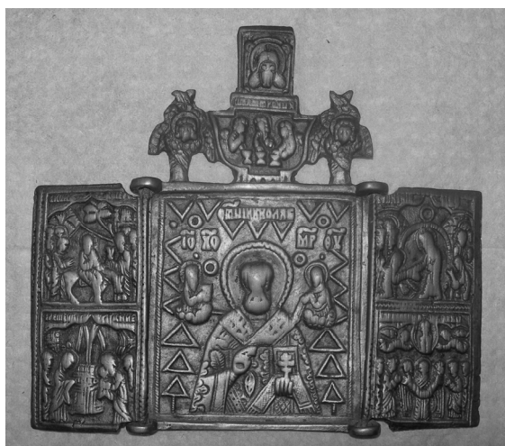
Рис. 4. Литая икона-кладень. Частная коллекция. Середина XIX в., Тара