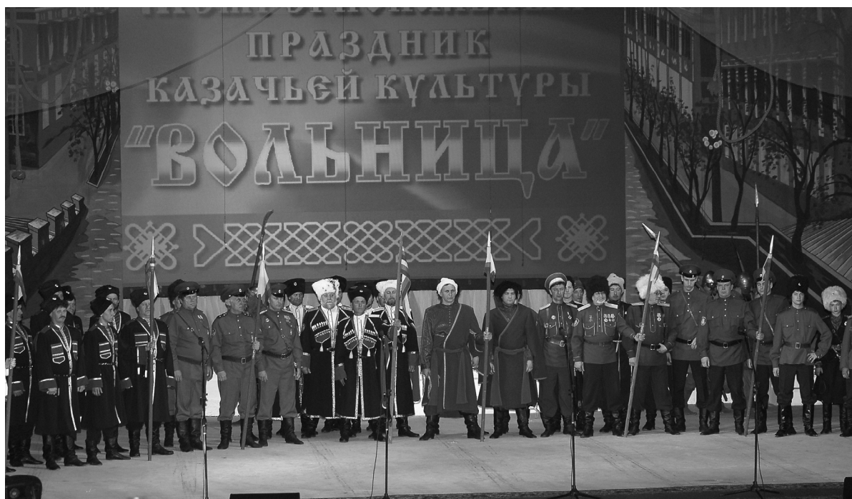
Рис. 5. Участники праздника «Вольница» 2010 г., Омск

При анализе полученных в 2000-е гг. материалов выяснилось, что существующие авто- и гетеростереотипы казачества существенно различаются. Так, согласно мнению самих казаков, характерными чертами для них являются смелость, воля, патриотизм,