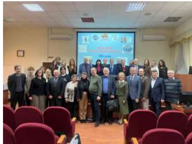
Участники завершения юбилейного совещания