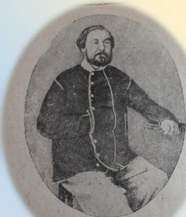
А. С. Некрасов, отец поэта.

Рисунок неизвестного художника 1850-х годов.