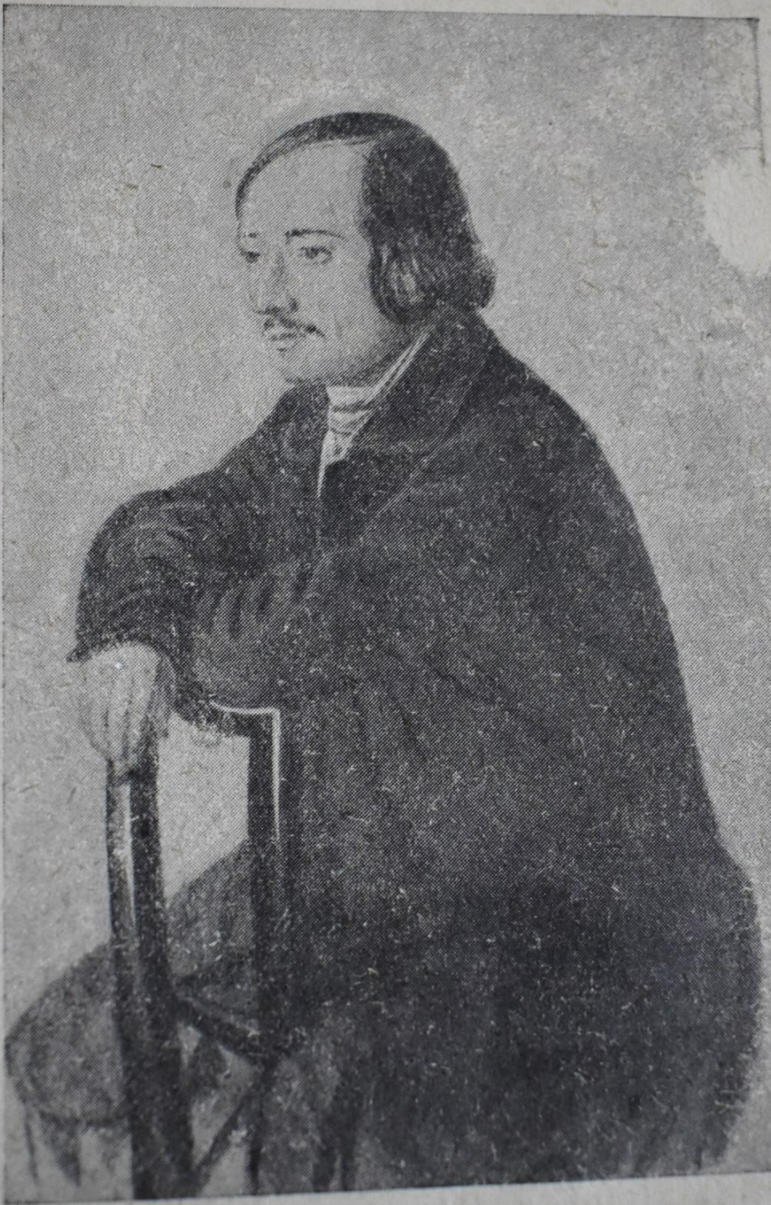
Некрасов в молодости. Аquatинг М. Захарова 1847 года.