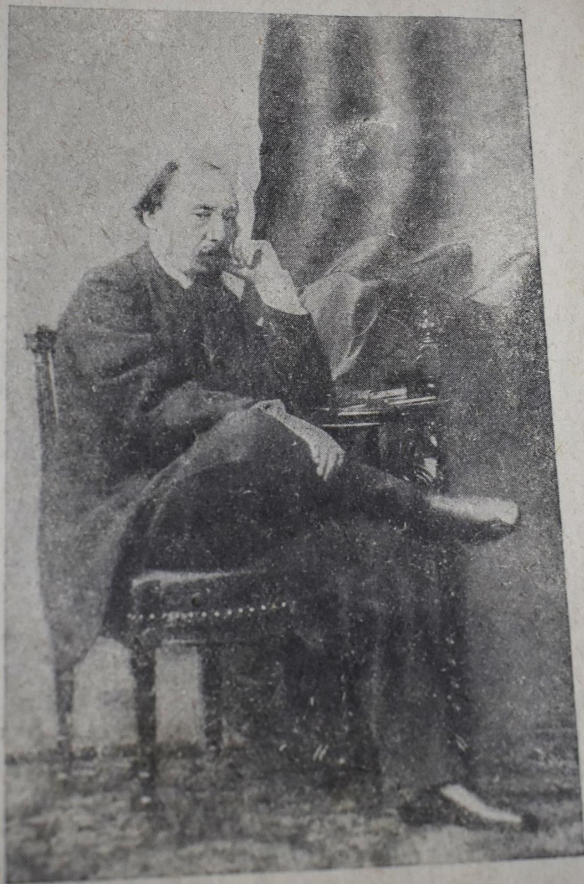
Н. А. Некрасов. Фотография середины 1860-х годов.