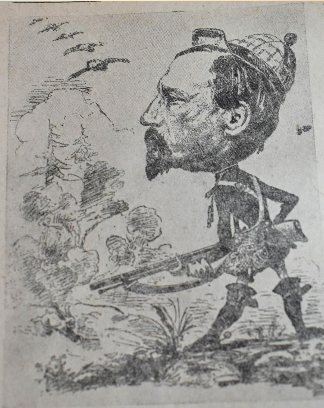
Некрасов на охоте. Карикатура А. Долотова 1869 года.