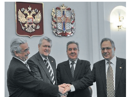
Соглашение о сотрудничестве между руководством Омской области и СО РАН подписано