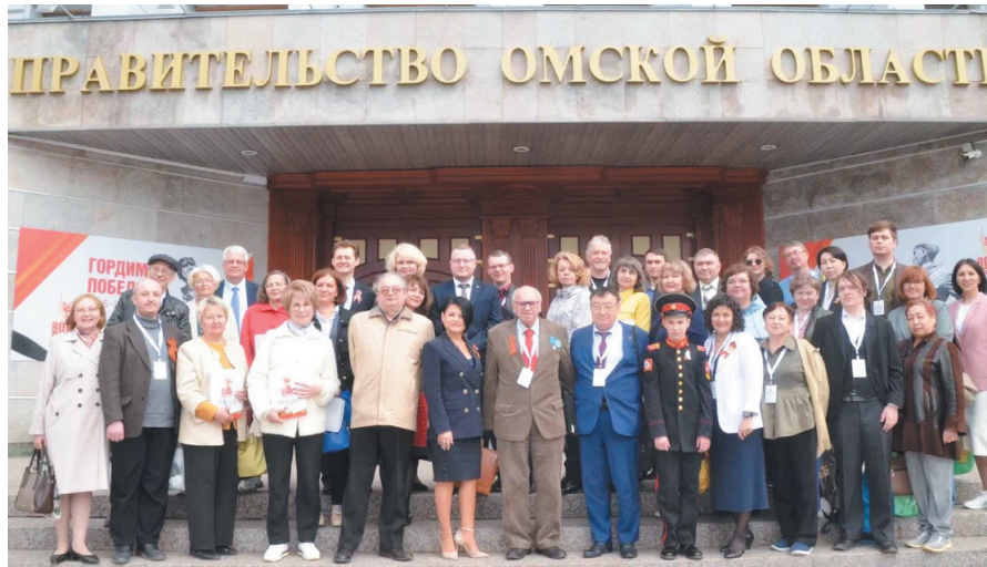
Участники VI Всероссийской научной конференции «Сибирь: вклад в победу в Великой Отечественной войне 1941–1945 гг.».