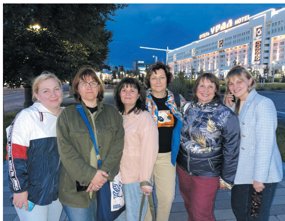
Прекрасная половина омской делегации на XVI Конгрессе антропологов и этнологов России. Пермь, июль 2025 г.

В ходе работы конгресса было проведено общее собрание Ассоциации антропологов и этнологов России, где обсуждались основные организационные итоги Конгресса, актуальные вопросы развития отечественной этнологии. Среди отмеченных проблем — сокращение количества кафедр по этнологии в российских вузах (отдельно представлена ситуация с кафедрой этнологии, антропологии, археологии и музеологии ОмГУ им. Ф. М. Достоевского, закрытой